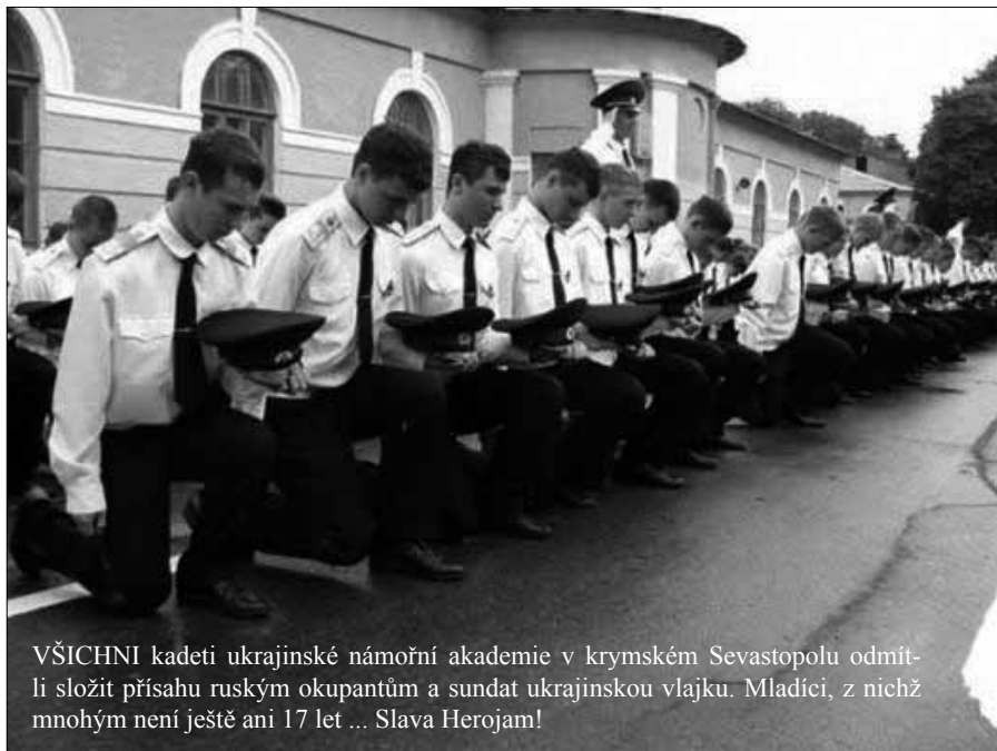
VŠICHNI kadeti ukrajinské námořní akademie v krymském Sevastopolu odmítli složit přísahu ruským okupantům a sundat ukrajinskou vlajku. Mladíci, z nichž mnohým není ještě ani 17 let ... Slava Herojam!

A vida, uplynulo sotva pár let a už chápou, co se stávalo lidem, když se měli postavit vypočítavému a cynickému agresorovi. Ta naděje, o všemže marná, že uklidňováním, omlouváním a vysvětlováním uchlácholíme toho cvoka a oddálíme nevyhnutelnou zkázu. Proč se solidárně angažovat v zájmu nějaké skoro neznámé země na východě, ostatně země, kterou ve své bezdůvodné nadutosti rádi považujeme za chudou a zaostalou, když na její území vstoupí armáda obávaná velmocí na povel velkášského diktátora? Ani není potřeba nějakých dohod v Mnichově, děje se to