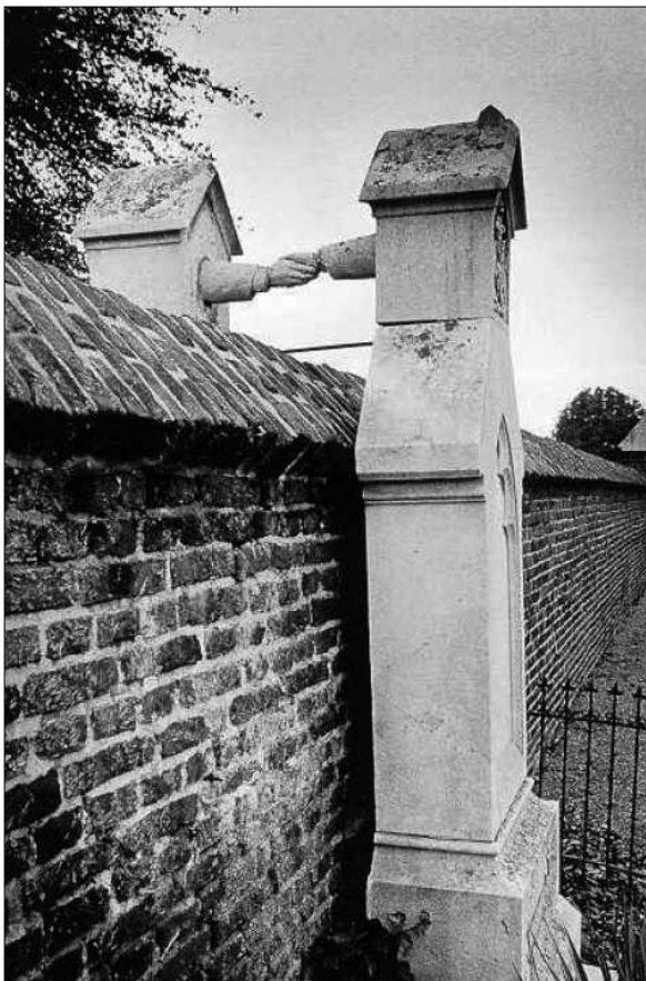
Manžel je pochován na katolickém hřbitově, manželka na protestanském. Přes zeď si podávají ruce.

upozornila, že se blíží konec a pokud chceme mamince poděkovat za život, ať to uděláme teď. Mě by to ani nenapadlo říkat, protože jsme nebyli zvyklí projevovat si city. Je to zvláštní, když vidíte blízkého člověka, který ještě dýchá, ale víte, že umírá. Zavolala jsem bratry, ať přijedou, že mamka odchází. Ještě jsem jí šeptala: „Mami, počkej ještě, přijedou bráchové...“ Bratři přijeli, rozloučili se s ní, pohladili ji a poděkovali za život. Stiskli jsme si ruku a maminka zemřela. Jsem moc ráda, že jsme tento okamžik klidného rozloučení