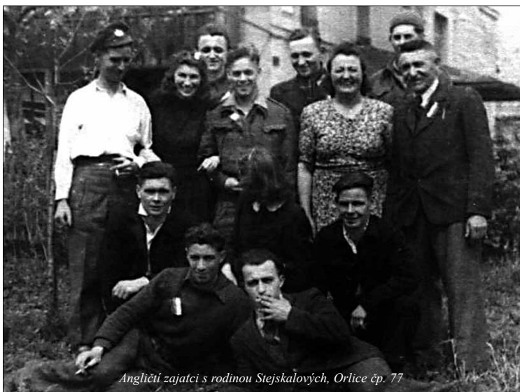
Angličtí zajatci s rodinou Stejskalových, Orlice čp. 77

Orličtí Angličané si chodili pro jídlo každý den k večeru až do vesnice, V. Adamec k tomu ve svých vzpomínkách uvádí: „Tam jsem jim vše donesl, vyměnil nádoby, trochu se polaskali s naším klukem, protože se jim rovněž stýskalo po jejich dětech. Náš malý kluk nám