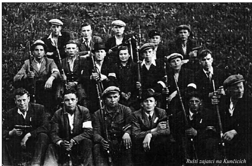
Ruští zajatci na Kunčicích