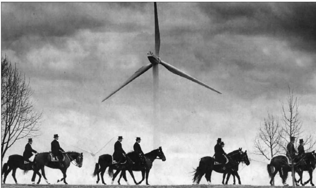
Lužičtí Srbové jedou každoročně zvěstovat Vzkříšení Krista sousedním vesnicím

Wajdův film ovšem není jen velkou historickou připomínkou, ale klade ústy svých postav i naléhavé otázky: co je kolaborace, co je zrada, co je věrnost pravdě. A předvádí, jak se za to platí. Otázky, které Wajdův film divákům klade, jsou otázky věčné, a je málo témat a situací, které by je vyvolávaly naléhavěji než katyňský zločin a jeho interpretace. Možná jednaosmdesátiletý Wajda nedostal Oscara proto, že západním divákům není na rozdíl od polských od začátku jasné,